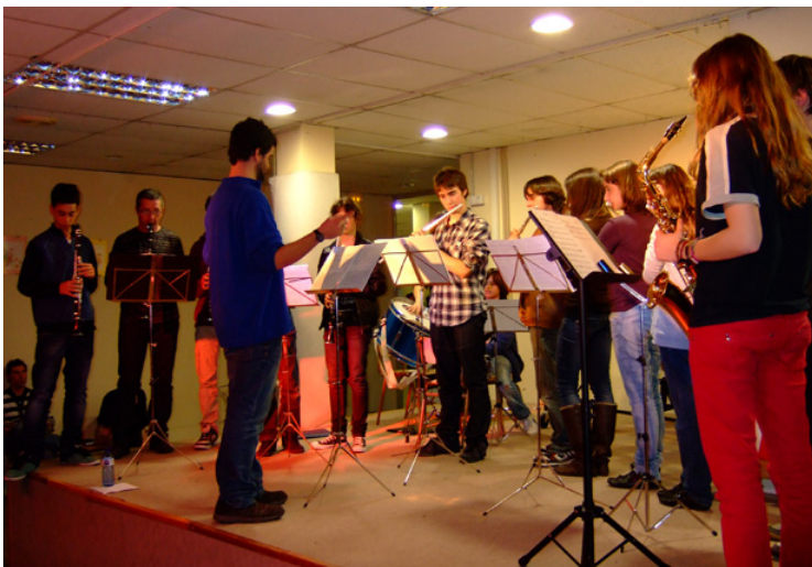
Alumnes de l'EMMM participant a les audicions de primavera de les seus Miquel Biada i Rocafonda.

El proper dies 9, 10 i 15 d'abril, l'EMMM té el plaer d'organitzar tres Concerts de Primavera a diversos espais de la ciutat amb l'objectiu que el màxim nombre de mataronins i mataronines en pugueu gaudir. Hem repartit els diversos conjunts instrumentals estables de l'escola en diversos escenaris, dies i ambients, també amb l'objectiu de que els estudiants de l'EMMM puguin viure aquesta experiència fora de l'ambient acadèmic de l'escola i oberta a tota la ciutat. Hi esteu tots convidats!